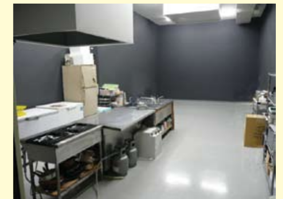
キッチンスタジオ全景