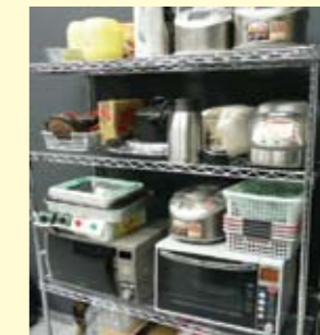
炊飯器、電子レンジ