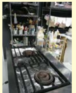
ガス、5kgプロパン使用